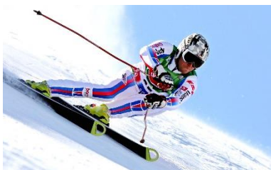
図3 アルペンスキー