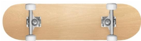
図6 一般的なスケートボードの裏側の様子

二人は器具庫にあったスケートボード（図6）を持ってきて、車輪のしくみを観察しました（図7）。