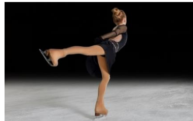
図2 フィギュアスケート