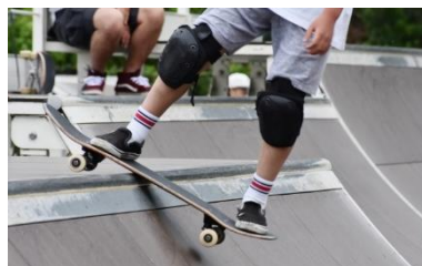
図4 スケートボード