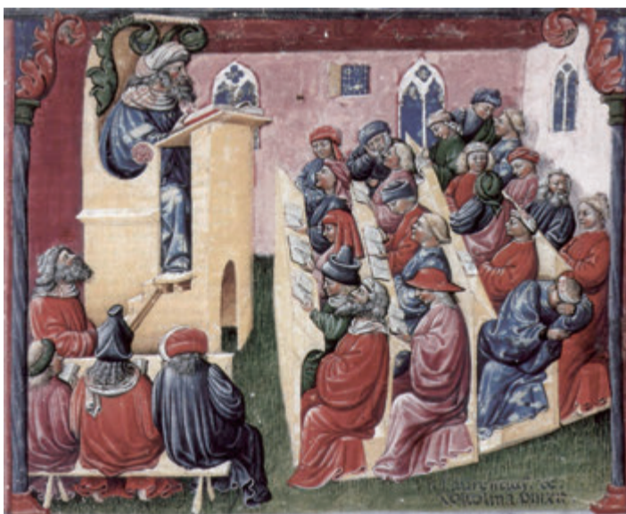
ボローニヤ大学における1350年代の講義風景を描いた写本挿絵 (Laurentius de Voltolina 画/Kupferstichkabinett Berlin 蔵)

一般に「研究」と「教育」を対して捉え、これが大学教員の任務であると考えられている。「研究