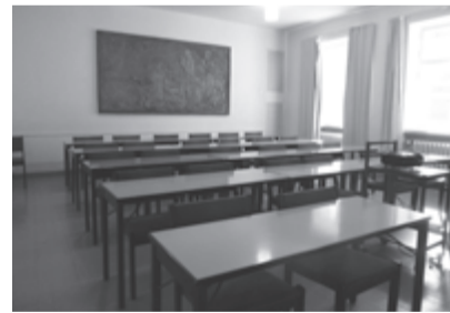
30年ぶりに訪れた教室。今はセミナーなどで使われている。(Helsinkiにて)

大学時代は日本文学を専攻した。サークルは考古学愛好会に所属し、八王子に校舎を建設する際の発掘調査にも参加した。中世の館跡が発見されたが、その記録だけを残して建設が続けられる現実に、文化を継承していくには、「教育」が必要だと思ひ、教師を志した。幸い、母校の共立女子高校で国語教師になることができた。