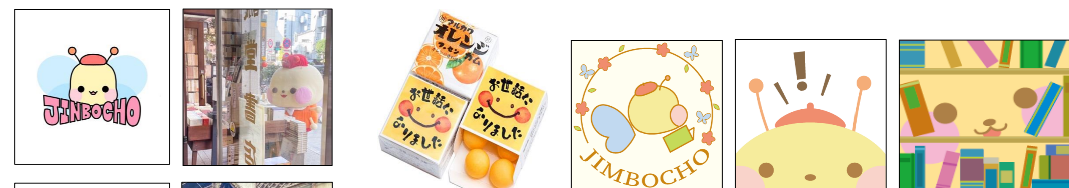
じんぼうちょうオリジナルパッケージのガムを制作

じんぼうちょうちゃんのグッズ製作は様々な観点から検討した結果、「実写グッズ」「お菓子」「のぼり」の3つに選定、実際に制作しました。