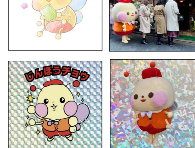
ステッカーデザイン 全6種類