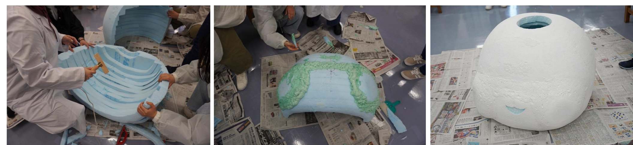
スタイロフォームを削る

昨年度に引き続き、じんぼうちょうちゃん修復する作業とグッズ製作を行ったのが、こちらの課題チームとなります。